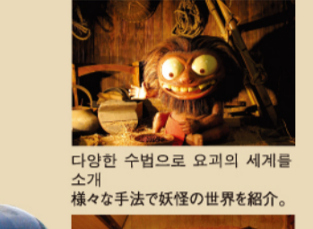
다양한 수법으로 요괴의 세계를 소개 様々な手法で妖怪の世界を紹介。