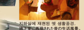
지하실에 재현된 옛 생활풍경. 地下室に再現された昔の生活風景。