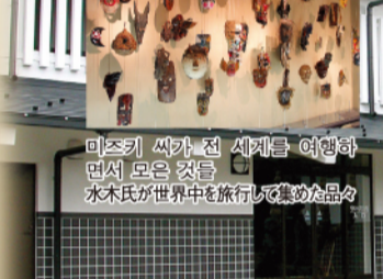
미즈키 씨가 전 세계를 여행하면서 모은 것들 水木氏が世界中を旅行して集めた品々

미즈키 시게루 기념관 미즈키 시게루 기념관은 입체적인 조명과 음향, 조형물에 의해 요괴가 실제 존재하는 듯한 분위기를 자아내고 있으며, 3면 스크린에는 요괴들이 활보하는 정경을 투영하여 관람객들이 직접 요괴를 체험할 수 있도록 되어 있습니다. 또, 미즈키 시게루 씨의 소개와 미즈키 시게루 씨의 세계 각국의 귀중한 수집품 등도 전시하고 있습니다.