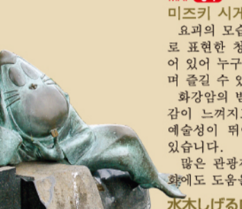
네즈미 오토코 ねずみ男

妖怪について 日本では、生活の中で不思議、奇妙だと感じられる現象に遭遇すると、妖怪の仕業と考えてきました。妖怪は、怠けたり、わがまました人間を懲らしめるほか、物を大切にしたり、自然や環境への配慮などを教えてくれる、多くの日本人にとって馴染みのある存在となっています。