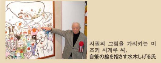
자필의 그림을 가리키는 미즈키 시게루 씨. 自筆の絵を指さす水木しげる氏

水木しげる 境港市で育った少年時代の体験から妖怪に興味を持ち、ゲゲゲの鬼太郎をはじめ妖怪を題材とした数多くの作品を発表。1991年に紫綬褒章、1996年に文部大臣賞、2003年旭日小綬賞を受賞するなど高い評価を受けています。