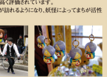
인력카를 타고 산책 人力車にのって散歩。