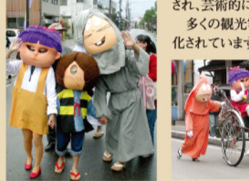
요괴들과 기념촬영 妖怪たちと記念撮影。