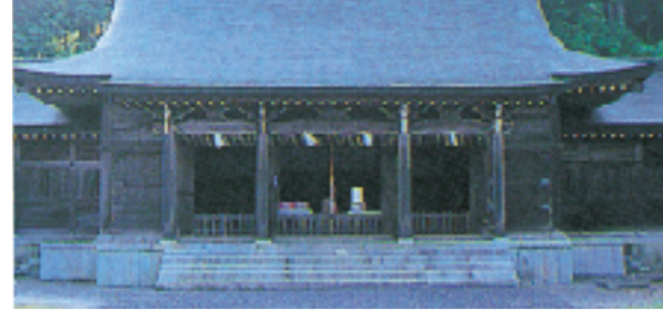
隠岐神社(島前) 昭和14年上皇の没後700年を記念して建てられました。