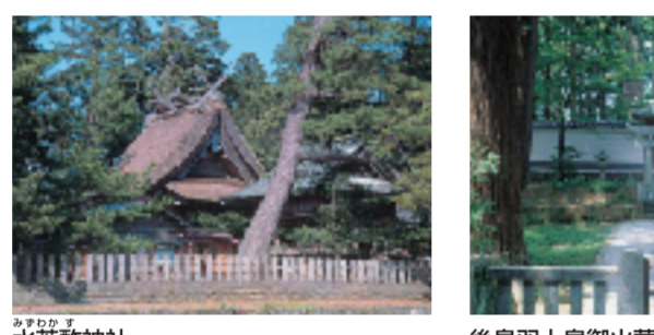
後鳥羽上皇御火葬塚 後鳥羽上皇が火葬された場所。白壁に囲まれた荘厳な御火葬塚に、上皇の遺灰が手厚く埋葬されている。