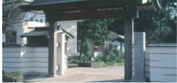
黒木御所・碧風館(隠岐・西ノ島町) 隠岐に流された後醍醐天皇が、過ごしたと伝わる行在所跡。天皇にまつわる文書が碧風館にあります。