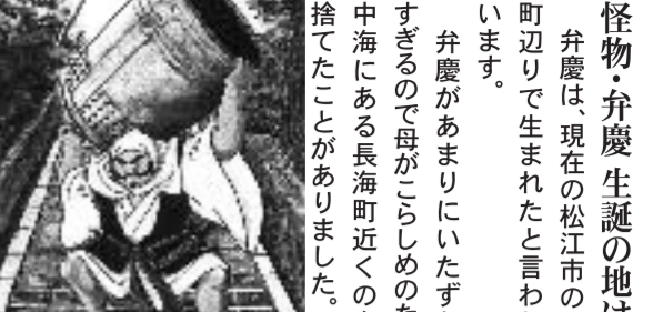
怪物・弁慶生誕の地は? 弁慶は現在の松江市の長海町辺りで生まれたと言われています。