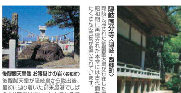
後醍醐天皇像 お腰掛けの岩(名和町) 後醍醐天皇が隠岐島から脱出後、最初に辿り着いた魚米産地ではしばらくお腰掛けになったと伝わる伝説の大岩。