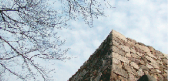
月山富田城跡(広瀬町) 悲劇の古城・月山富田城。月山富田城は、安来市広瀬町にあります。