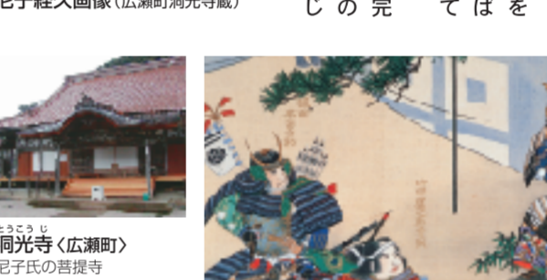
尼子経久画像(広瀬町洞光寺蔵) 洞光寺(広瀬町) 尼子氏の菩提寺